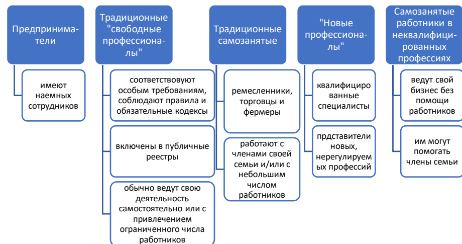
Рис. 2. Основные виды самозанятости в зарубежных странах

Классификация основных видов самозанятых, нивелирующая национальные контексты, правовые рамки и различия, приведена на рис. 2.