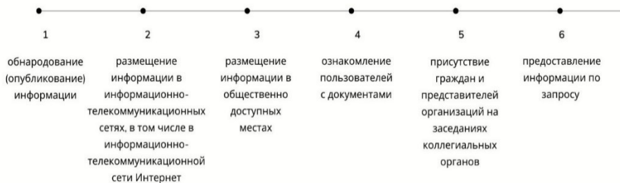
Рис. 1. Способы предоставления доступа к информации о деятельности государственных органов*

На современном этапе определено, что доступ к информации о деятельности государственных органов может обеспечиваться в форме предоставления и распространения, а также шестью способами, представленными на рис. 1.